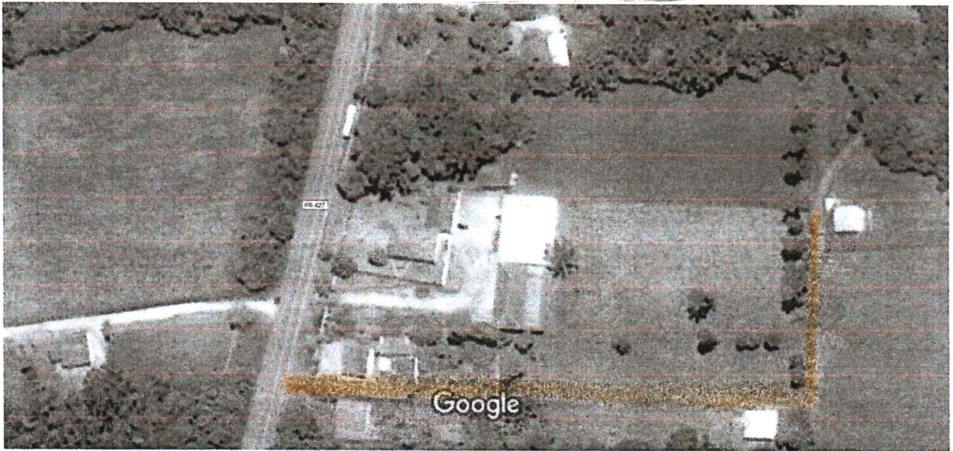
Imagens ©2017 CNES / Astrium,DigitalGlobe,Dados do mapa ©2017 Google 20 m