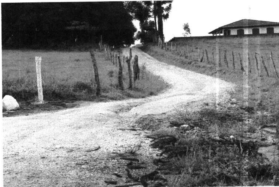
Estrada que dá acesso a propriedade da senhora Adriana Staron encontra-se com valetas no meio da rua, causando dificuldade na passagem dos veículos.